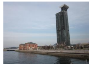
門司港レトロ展望室(右)

また、周辺には門司港レトロ展望室や旧門司税関、 はね橋「ブルーウイングもじ」など、見どころが たくさんあります。